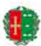
Edume Torrealdeai Erezuma Arrietako Udaleko alkatea

Gure gomendio bakarra: lanok irakurtzeko tartetxo bat hartzea -ezusteko polita hartuko dozue-, eta datorren lehiaketarako animatzea.